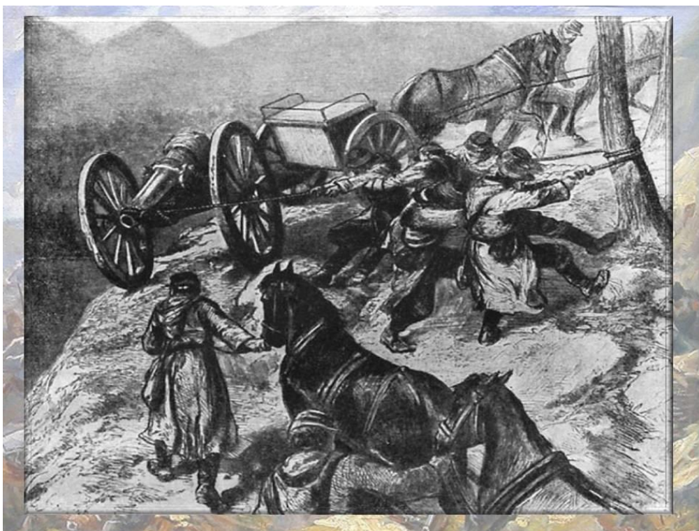
Преминаване на Балкана Худ. Н. Каразин

От западните кореспонденти най-продуктивен е испанският художник Хосе Луис Пелисер, кореспондент на списанието „Илюстрасион Еспаньола и Американа“, което по време на войната излиза в Мадрид, но се разпространява и за Латинска Америка. Много от гравюрите са без посочен автор. За руското издание „Илюстрированная хроника войны“ работят Н. Каразин, Медведев, Ризников и др.