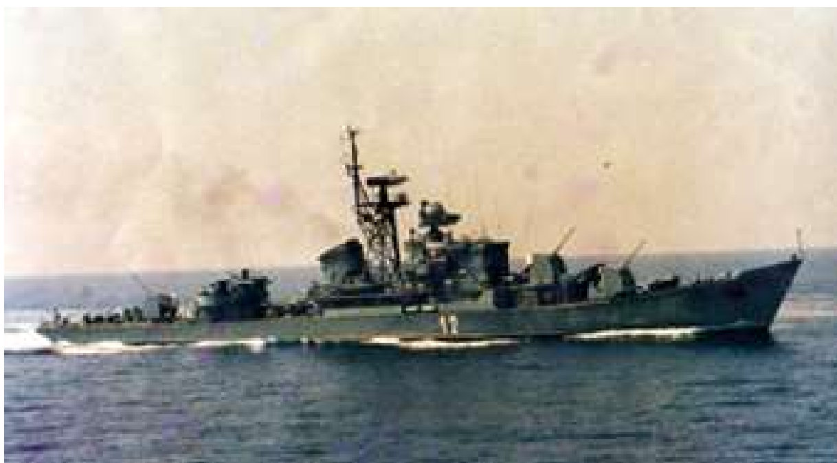
СКР „Смели“ пр.50