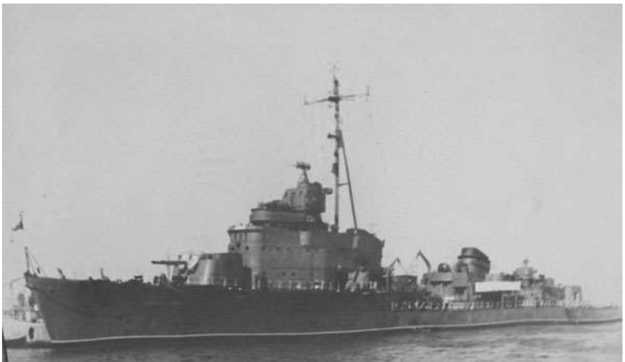
Ескадрен миноносец „Г. Димитров“