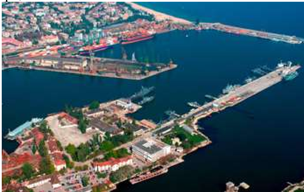
Военноморска база - Варна