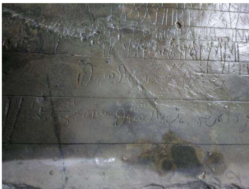
Приложение 6 – Олтарна плоча от село Турян – фрагмент