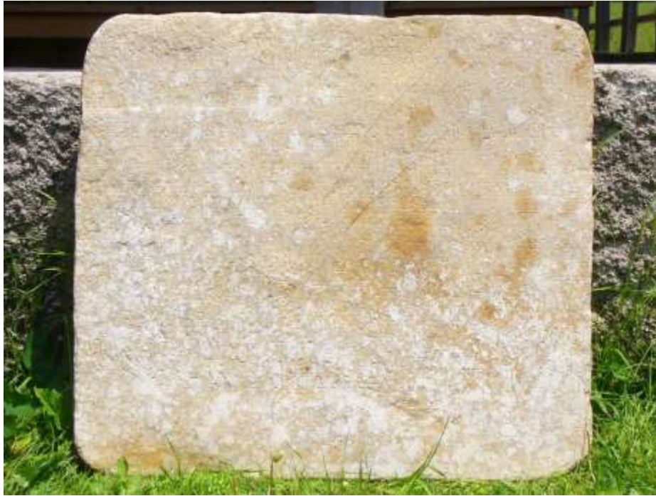
Приложение 2 – Плочата от параклиса край Гела

Още в края на 80-те години на миналия век писателят и изследовател Никола Гигов подсказва идеята си, че в родопското село Гела има запазени реликви от времето на Орфей. Това са наличието на древни гробници с хокерни погребения, Харонов обол, Делфинов пръстен, златна корона, патриаршески жезъл, древни пътища, скални изображения, стари светилища и други. Към този род реликти по-късно той отнася и въпросната олтарна плоча.