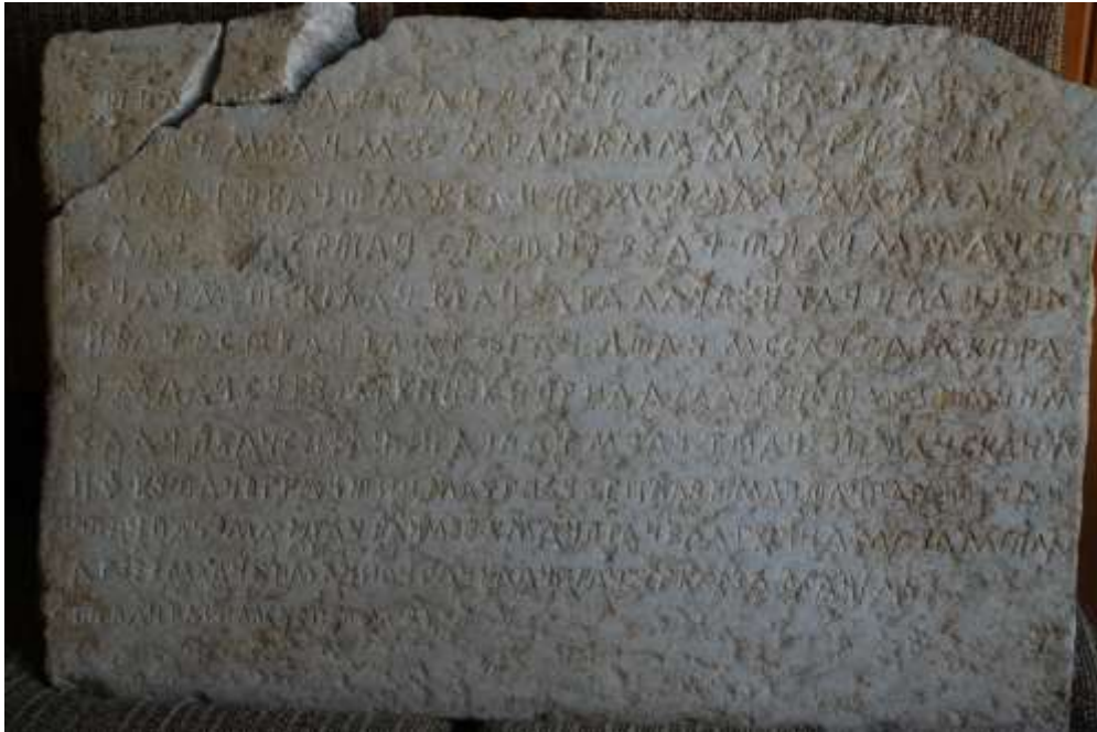
Приложение 3 – Олтарна плоча от църквата св. Илия в Широка Лъка

Част от каменните плочи с надписи от параклисите и църквите в Родопите са доста еднакви по отношение на начина на изписване и стила на буквите. Така например плочата от параклиса св. Илия край Гела и тази от Широка Лъка отново от параклис на името на св. Илия са доста близки, както и тази от параклиса на св. Георги край село Върбово (приложение 3 и 4).