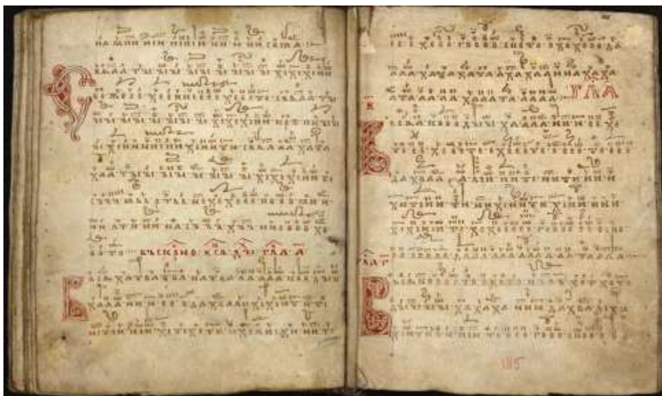
Приложение 8 – Образец на кондакарна нотация

Буквеният нотопис от тези олтарни плочи е съчетан вероятно с някои невмени знаци, както е видно на плочата от с. Турян. Както споменахме, византийският невмен нотопис е използван по нашите земи още от VII век, чак до края на XIX век. Трябва да добавим и възможността тук да са използвани и знаците от така наречената кондакарна нотация, засвидетелствана в Русия по образци от XII-XIII век (приложение 8).