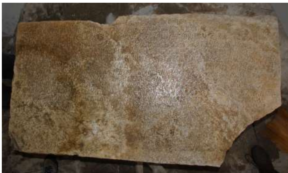
Приложение 4 – Олтарна плоча от параклиса на св. Георги в село Върбово